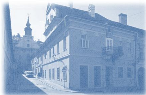
Rodna kuća Josipa bana Jelačića u Petrovaradinu

Kuća Josipa bana Jelačića u vlasništvu je Hrvatskog nacionalnog vijeća samo djelomice zbog poteškoća nastalih prilikom njenog otkupa, a čije rješavanje je u tijeku.